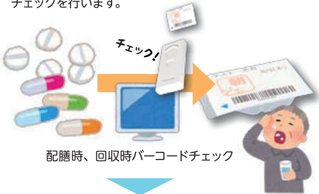
配膳時、回収時バーコードチェック