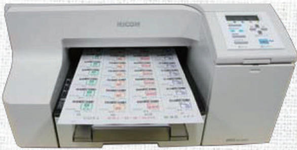
蓋シートにプリンターで印字します