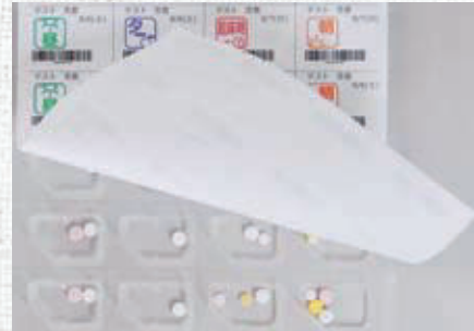
蓋シートを貼り付けると完成です