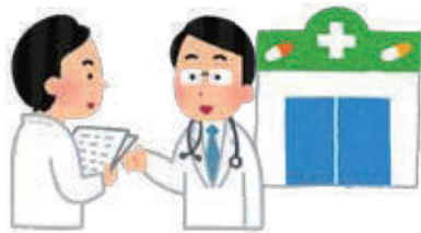
服薬情報を薬局で管理