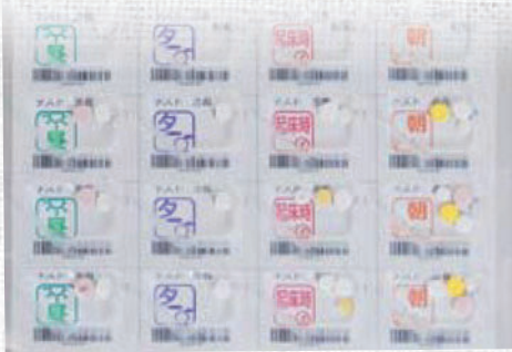
お薬カレンダーのマス目に薬を入れます