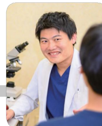
ドクターメイトの医師