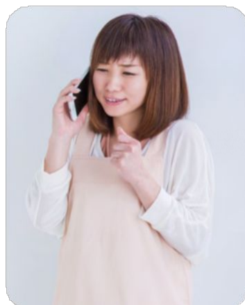
施設夜間スタッフ