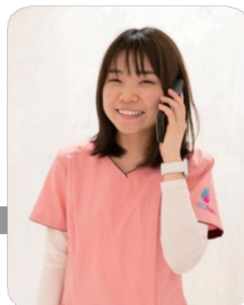
ドクターメイトの看護師